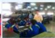
▲技藝教育-動力機械