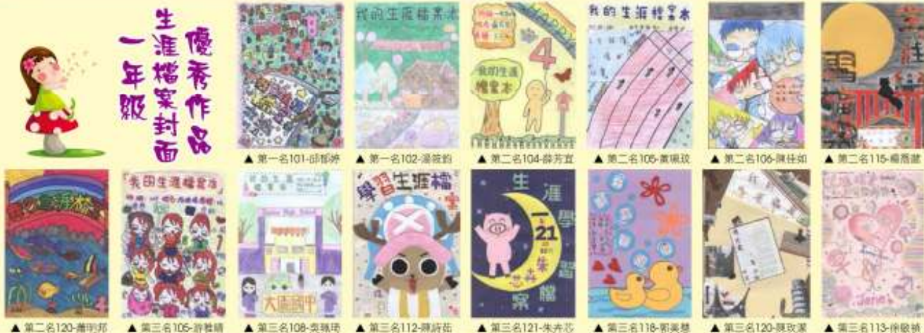
▲第一名101-邱郁婷 ▲第一名102-湯筱鈞 ▲第二名104-蔡芳宜 ▲第二名105-黃順玟 ▲第二名106-陳仕如 ▲第二名115-楊高遠 ▲第二名120-蕭明邦 ▲第三名105-許雅晴 ▲第三名108-吳瑛琦 ▲第三名112-陳蔚蔚 ▲第三名121-朱卉芯 ▲第三名118-郭奕慧 ▲第三名120-張淑潔 ▲第三名113-徐敏琪