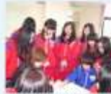
▲技藝教育-家政班群