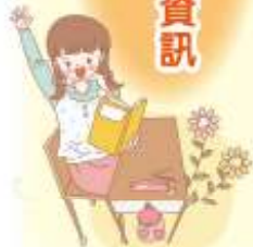
103年國中基本學力測驗中學生適性入學諮詢專線及網站